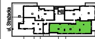
SCHEMAT - LOKALIZACJA MIESZKANIA

ADRES BUDYNKU: Ul. Strażacka 114 04-455 Warszawa Rembertów