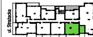
SCHEMAT - LOKALIZACJA MIESZKANIA

ADRES BUDYNKU: Ul. Strazacka 114 04-455 Warszawa Rembertów