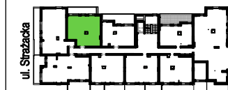
SCHEMAT - LOKALIZACJA MIESZKANIA

ADRES BUDYNKU: Ul. Strazacka 114 04-455 Warszawa Rembertów